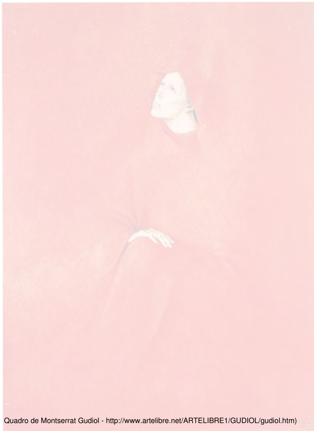
Quadro de Montserrat Gudiol - http://www.artelibre.net/ARTELIBRE1/GUDIOL/gudiol.htm )

Mas se houvesse algum embaraço Dera a moça um mal passo Quanto horror e desdém Ela ia parar no convento la dormir ao relento Ou deitar nos trilhos do trem (Música: Opereta do Casamento - Chico Buarque)