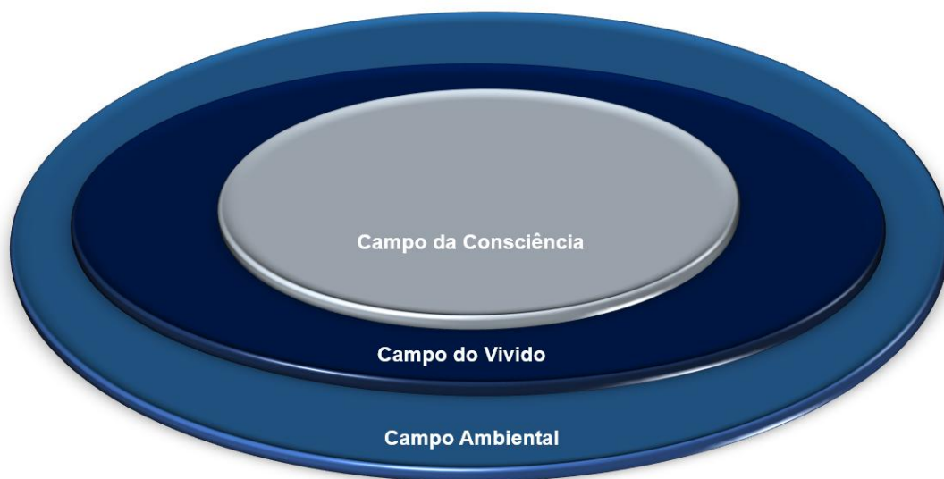
Figura 01 – Diagrama 3D – Subestruturas de campo - baseado em Bleger (1963/2012, p. 38)

relatos impressionantes desse fato, tal como, por exemplo, aquele que nos faz o filho do filósofo Politzer que, recuperou, por meio dos sonhos que teve como idoso, percepções infantis que, ao que tudo indica, dificilmente teriam chegado a se tornar conscientes no período em que era criança, mas que mesmo assim o teriam marcado (Politzer, 2013) 24 .